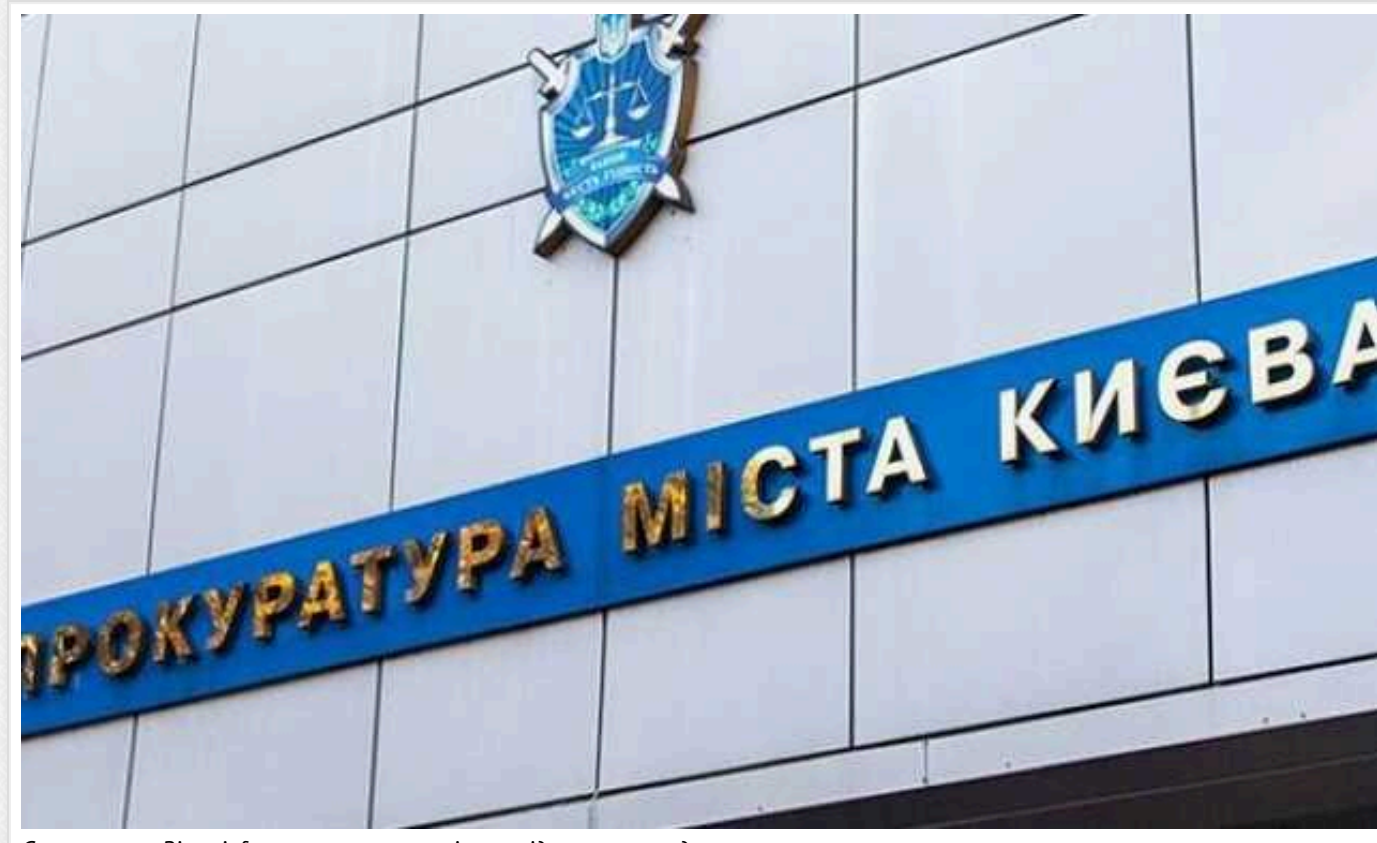
Стеження за Вігус.Інфо: за заявою журналістки відкрито провадження

Київська обласна прокуратура розпочала кримінальне провадження на підставі заяви журналістки Вігус.Інфо, яка фігурувала на скандальному відео, яке нещодавно поширилося у мережі. Жінка заявила, що невідомі особи незаконно зібрали та поширили конфіденційну інформацію про неї.