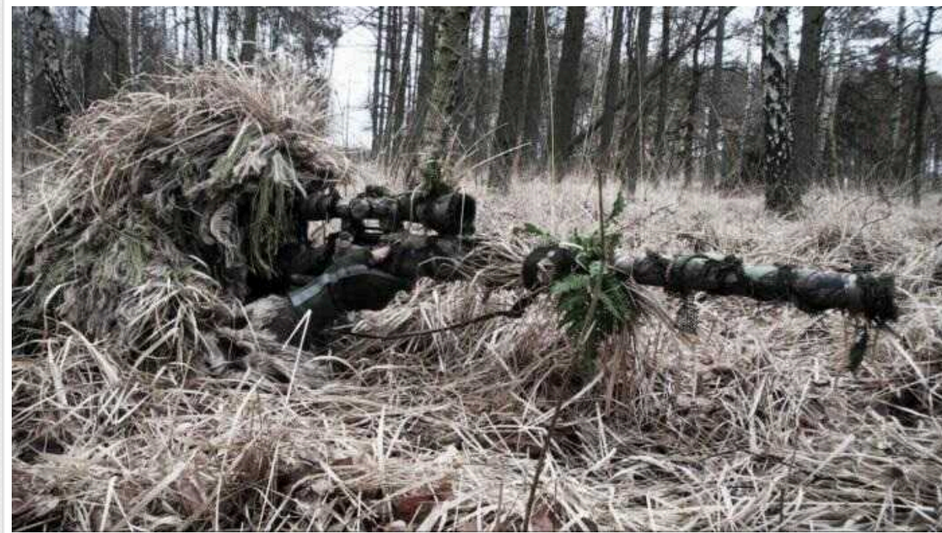
Снайпер із позивним "Одеса" мінує двох окупантів на Бахмутському напрямку

Снайпер Державної прикордонної служби з позивним "Одеса" знищує двох російських окупантів на Бахмутському напрямку. Захисник майстерно відпрацював з української гвинтівки UAR-10.