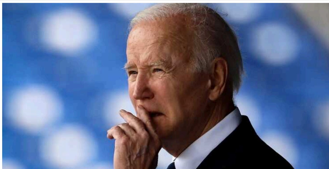
WSJ: Байден погоджується на посилення імміграційної політики, щоб відвести критику та забезпечити допомогу Україні

За повідомленнями, президент США Джо Байден погодився на посилення імміграційної політики, що може зробити можливою нову військову допомогу для України та Ізраїлю.