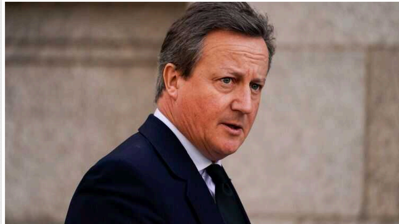
Сполучені Штати витратили лише 10% свого оборонного бюджету на знищення 50% російського озброєння

США витратили 10% свого оборонного бюджету, щоб знищити 50% російського озброєння, не втративши жодного американця.