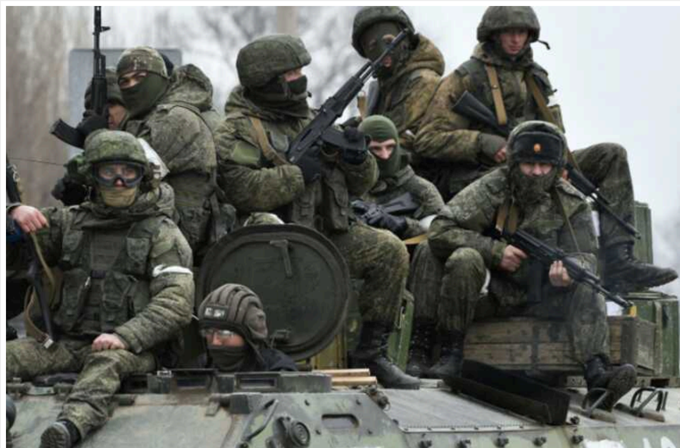
У ЗСУ пояснили, чому окупанти добивають своїх поранених під Авдіївкою