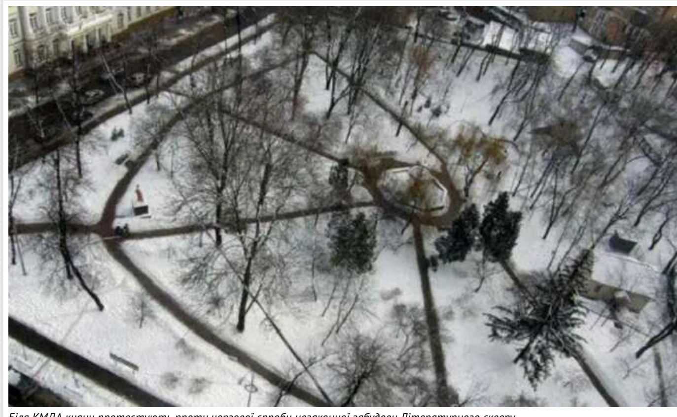
Біля КМДА кияни протестують проти чергової спроби незаконної забудови Літературного скверу

У столиці зранку 18 січня під стінами Київської міської державної адміністрації (КМДА) небайдужі кияни зібралися на мітинг за збереження Літературного скверу по вулиці Олеса Гончара. Забудовники намагаються звести висотну будівлю впритул до скверу, незважаючи на протести місцевих мешканців.