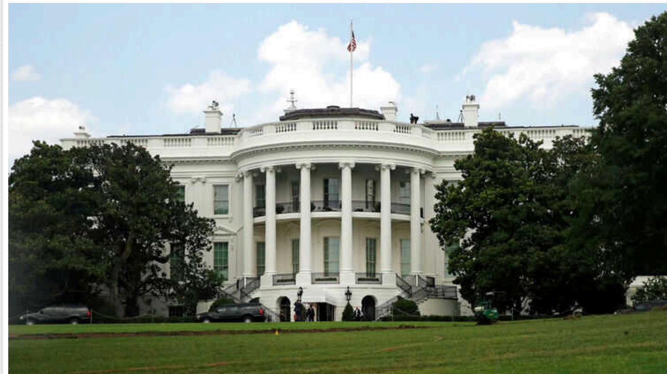
Зустріч Байдена та керівництва Конгресу не призвела до виходу з глухого кута у питанні допомоги Україні - ЗМІ

Зустріч у Білому домі керівництва Конгресу та президента США Джо Байдена "мало що зробила для виходу з глухого кута у питанні допомоги Україні".