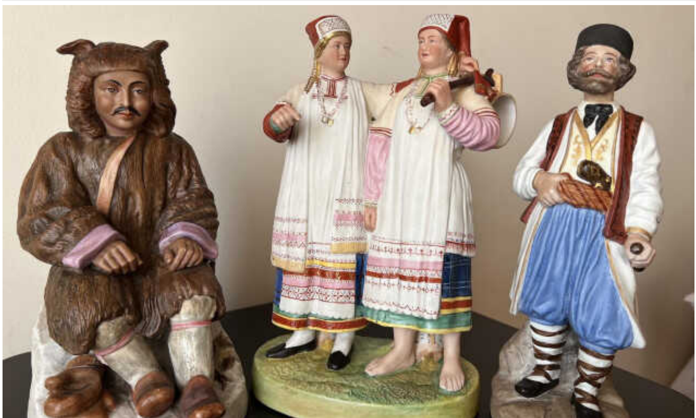
Київські митники вилучили рідкісну гарднерівську порцеляну 19-20 століття

Київські митники припинили кілька спроб пересилання порцелянових скульптур у міжнародних поштових відправленнях з Одеси до Казахстану. Скульптури мали явні ознаки старовини. Експертиза виявила, що у відправленнях була рідкісна скульптурна пластика фабрики шотландця Франца Гарднера, що функціонувала з 1766 року в Російській імперії на Московщині. Скульптурки мають культурну цінність, а загальна оцінка (не комерційна) вартість виробів становить 400 тис грн.