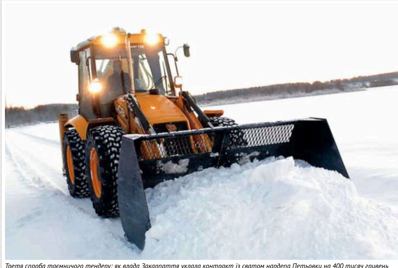
Третя спроба таємничого тендеру: як влада Закарпаття уклала контракт із сватом нардепа Петьовки на 400 тисяч гривень

На початку поточного року Виноградівське виробниче управління житлово-комунального господарства провітувало про підписання контракту щодо надання послуг утримання дорожньої мережі на території Виноградівської ОТГ у зимовий період. Загальну вартість робіт, які підрядник виконуватиме до кінця 2024 року, замовник оцінив у 400 тисяч гривень. Договір уклали з ФОПом Миколою Васильовичем Гречанюком, який має чималий досвід співпраці з виноградівським управлінням ЖКГ.