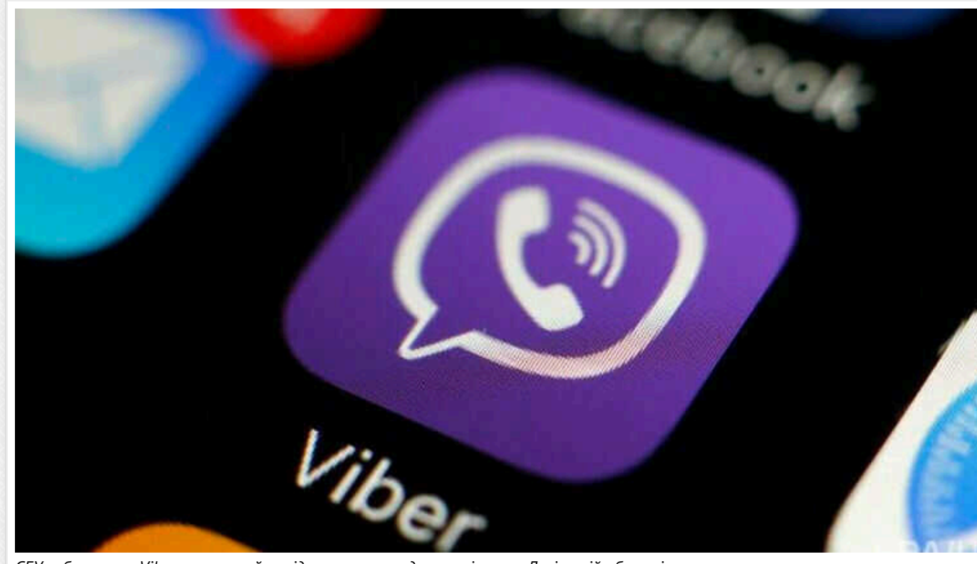
СБУ заблокувала Viber-канал, який повідомляв про роздачу повісток у Львівській області

Служба безпеки України заблокувала популярний канал у Viber, який повідомляв про роздачу повісток у Львівській області та закликав ховатися від ТЦК.