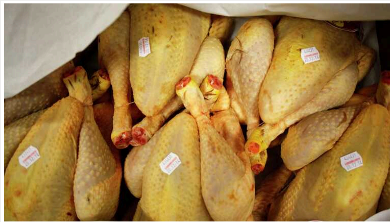
Нижньоворітська сільрада планує купувати курятину за завищеними цінами у ФОПа із бізнес-зв'язками з підприємцями-депутатами