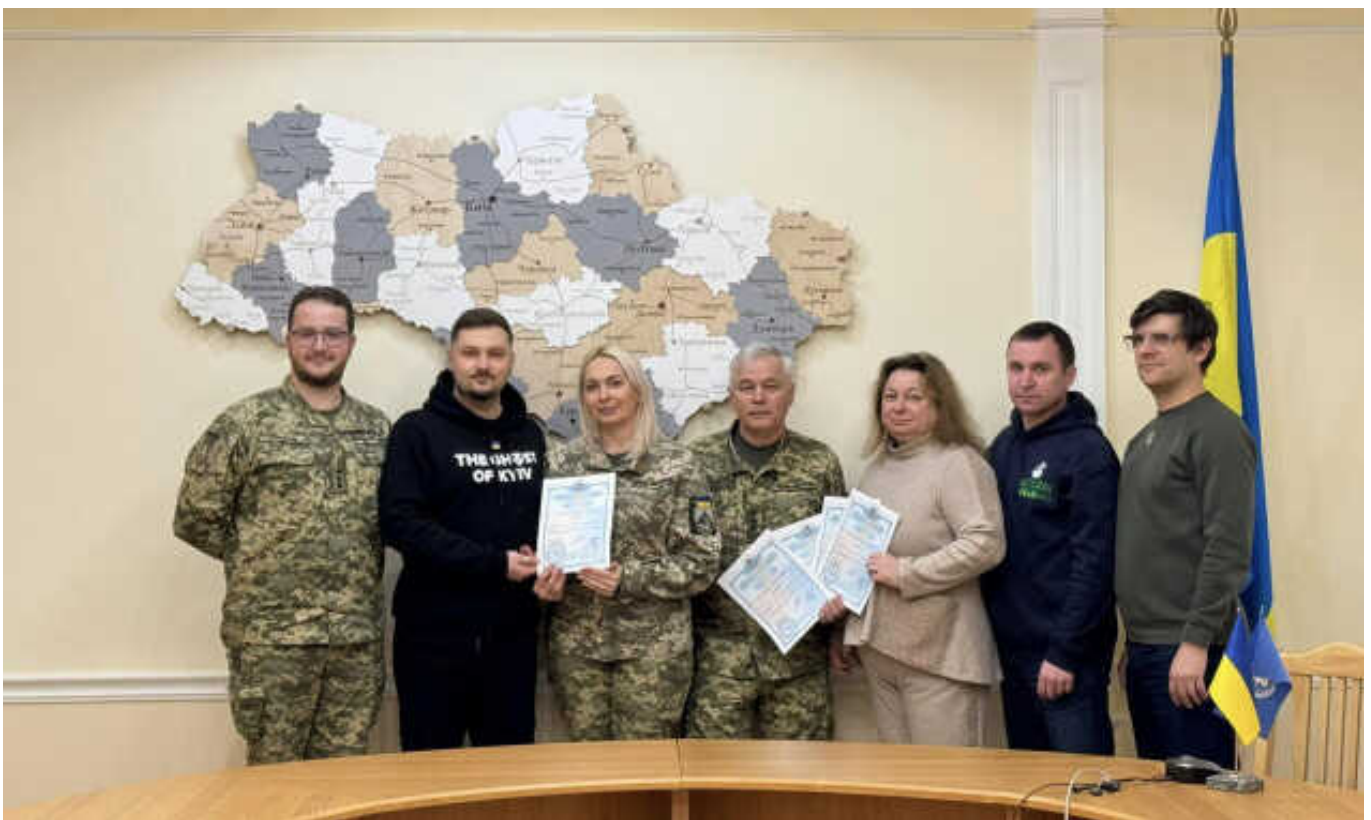
“Привид Києва” отримав власну торгову марку

Український національний офіс інтелектуальної власності та інновацій (УКРНОІВІ) офіційно зареєстрував торговельну марку легендарного “Привида Києва”. Таким чином державний орган підтримав ініціативу військовослужбовців 40 бригади тактичної авіації та інших бойових підрозділів Повітряного командування “Центр”, громадської організації “Захисники Неба”, які виступили проти спекулювання та комерціалізації сторонніми особами на Героїчному образі льотчиків – захисників Києва.