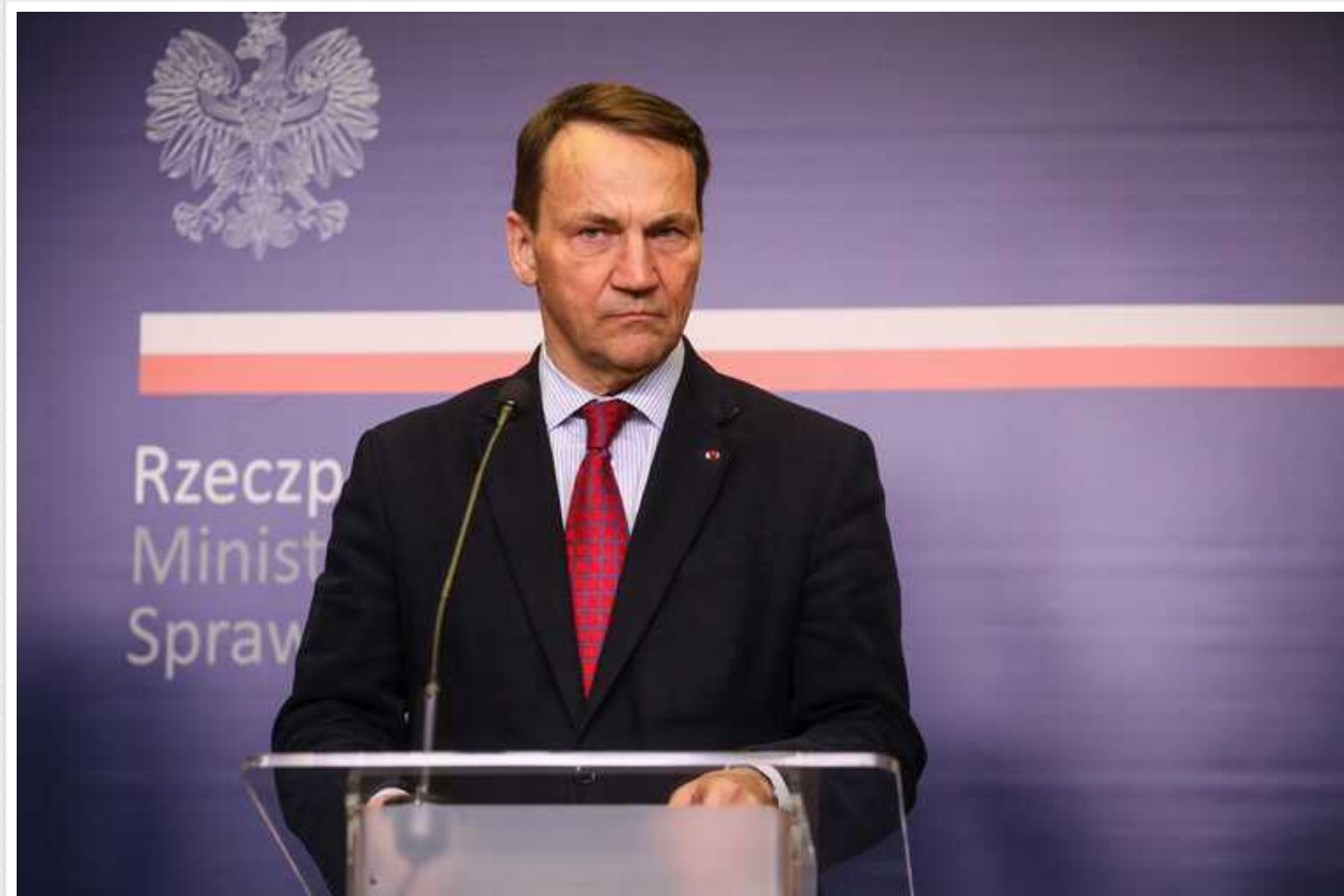
"Кишенькових Чемберленів" не бракує, - глава МЗС Польщі про схилення України до переговорів

Міністр закордонних справ Польщі Радослав Сікорський розкритикував ідею схилити Україну до мирних переговорів з Росією, згадавши про "кишенькових Чемберленів".