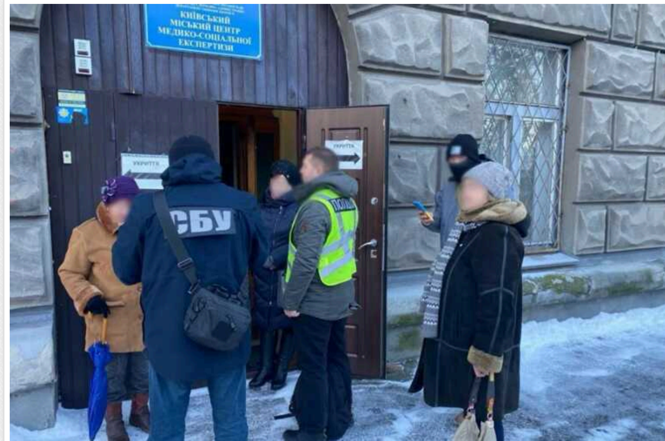
У столиці викрили чергову схему переправлення ухиливтів через кордон

У Києві викрили чергову схему незаконного переправлення військовозобов'язаних за кордон. Вартість "послуг" становила від 5 до 8 тисяч доларів США.