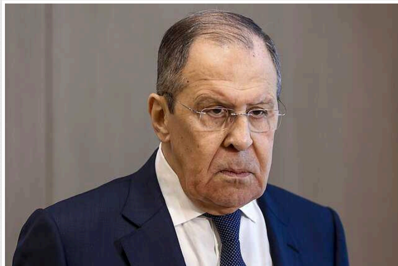
В МЗС РФ зробили нову заяву про переговори з Україною: "Важче буде домовлятися"

Росія продовжує грати в "жертву" і скаржитися, нібито з нею не хочуть вести переговори про завершення війни в Україні та "мир", звісно ж, на кремлівських умовах. Там стверджують, що це Захід і НАТО відтягують цей процес, лише ускладнюючи все.