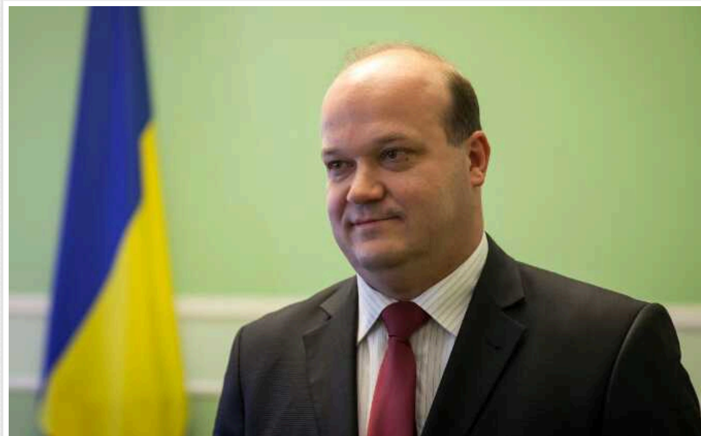
Чалий спрогнозував, коли РФ наважиться на провокацію країн НАТО

Голова правління Українського кризового медіа-центру та посол України у США у 2015–2019 роках Валерій Чалий в інтерв'ю Radio NV спрогнозував, коли Росія може напасти на якусь із країн НАТО чи, щонайменше, наважиться на провокацію.