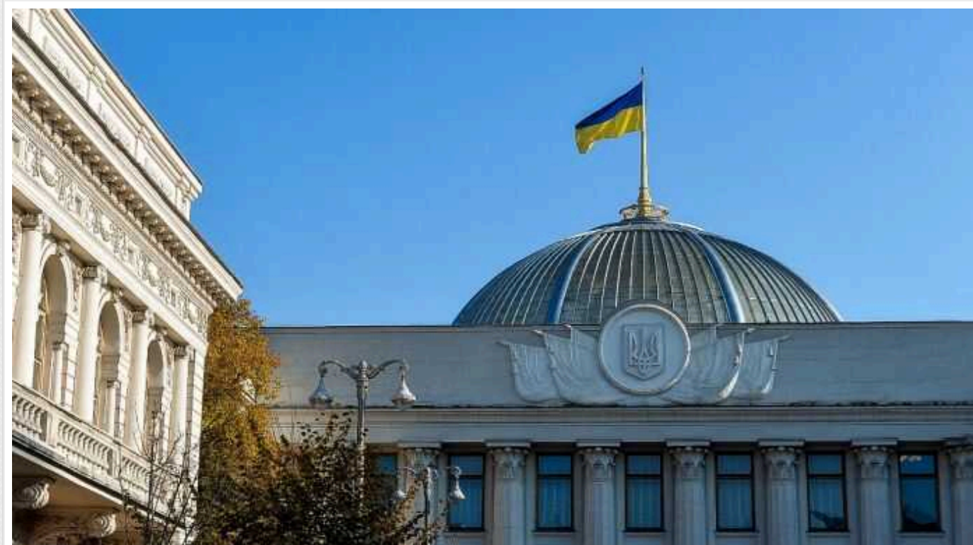
У Верховній Раді чекають на новий законопроект про мобілізацію на початку лютого

Народні депутати очікують на другу версію законопроекту про вдосконалення мобілізації у перший тиждень лютого, але поки що уряд не сильно змінив свої пропозиції.