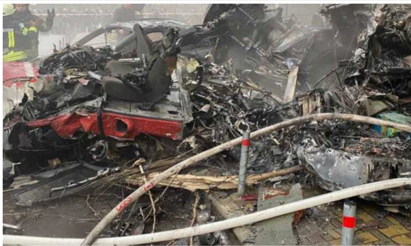
Роковини трагедії у Броварах: причини катастрофи та обставини, пов'язані із керівництвом МВС

Рівно рік тому, 18 січня 2023 у Броварах розбився гелікоптер із керівництвом МВС на борту. Внаслідок авіакатастрофи загинуло 14 осіб, серед них були міністр внутрішніх справ Денис Монастирський та його заступник Євген Єнін.