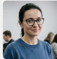
Юлія Більченко ВИПУСКОВИЙ РЕДАКТОР

Теги: Гуменюк Наталія Гуменюк Напад Росії на Україну бойові действия фронт Херсон ЗСУ ВСУ