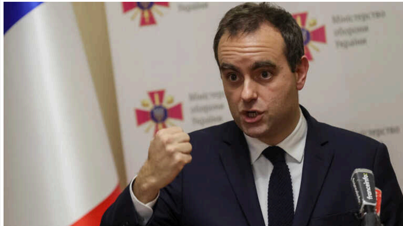
Франція буде надавати Україні щомісяця до 50 авіабомб, – міністр Лекорню

Франція буде постачати Україні до 50 авіабомб щомісяця до кінця 2024 року. Також Париж збільшить постачання артилерійських боєприпасів.