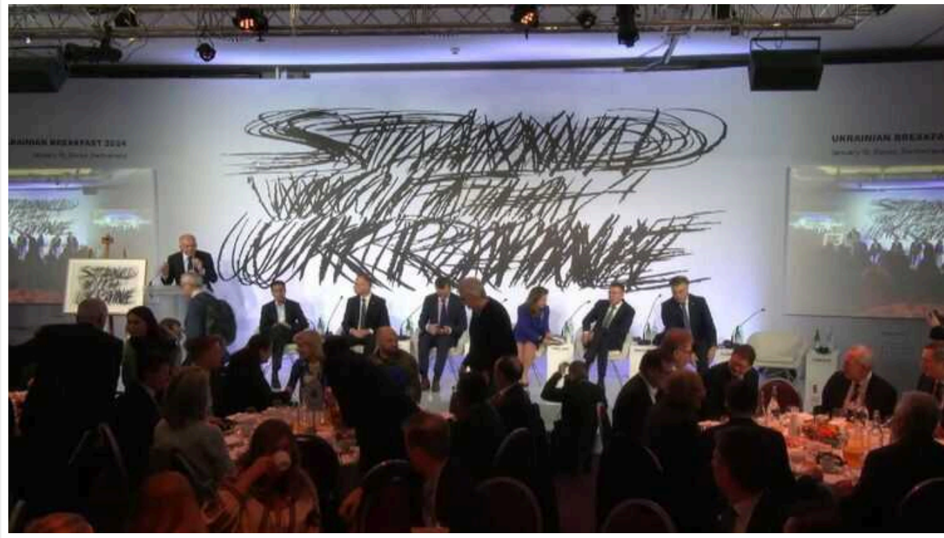
У Давосі розпочався традиційний український сніданок під логотипом "Stand with Ukraine"

У Давосі розпочався традиційний український сніданок, організований мільярдером Віктором Пінчуком.