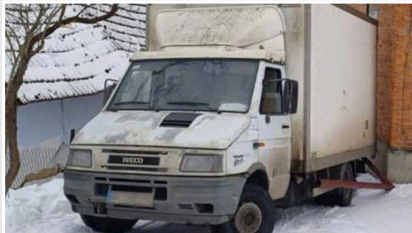
ДТП на Львівщині: вантажний автомобіль збив 16-річного юнака рухаючись заднім ходом

У Пустомитах , внаслідок наїзду автомобіля Iveco, було важко травмовано 16-річного школяра. Машина, рухаючись заднім ходом, збила хлопця у середу по обіді, 17 січня, повідомила пресслужба поліції. Підлітка шпиталізували у реанімацію.