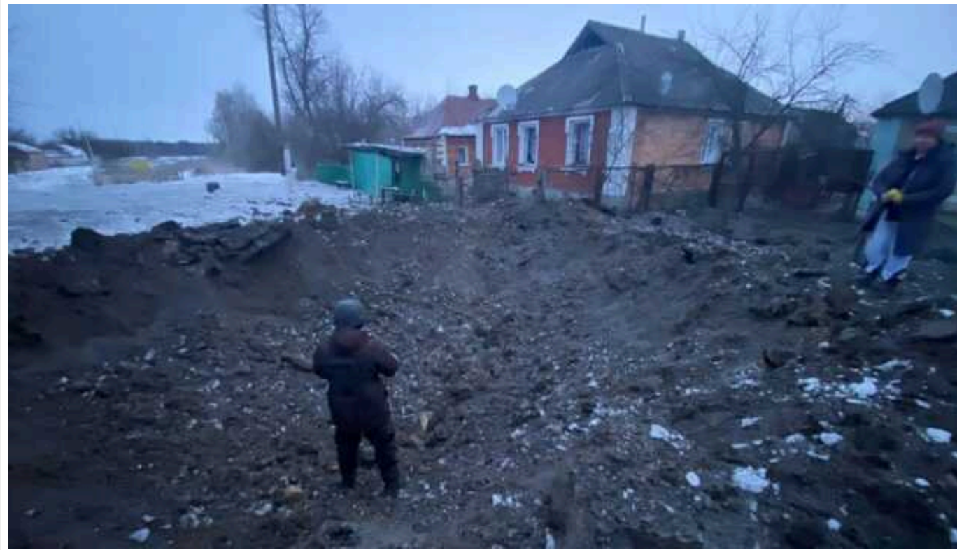
Окупанти обстріляли понад 15 населених пунктів Харківської області: є двоє загиблих

Російські війська здійснили обстріли понад 15 населених пунктів Харківської області, двоє людей загинули.