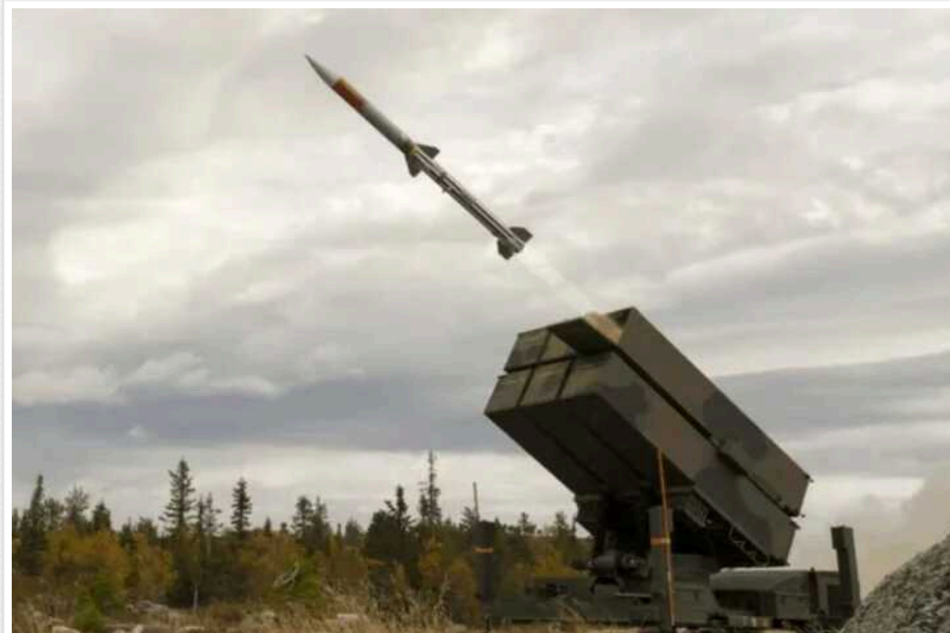
Канада закликала США швидше передати Україні систему ППО NASAMS, яку придбали ще рік тому

Канада офіційно звернулася до Сполучених Штатів Америки із закликом прискорити передачу збройним силам України зенітно-ракетного комплексу NASAMS. Країна оплатила цю систему ППО для України ще на початку 2023 року.