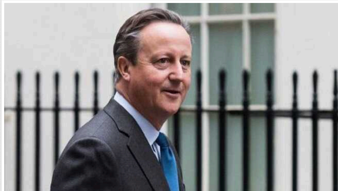
Камерон провів паралелі між Путіним і Гітлером і закликав не умиряти президента РФ

Глава МЗС Великої Британії має відчуття, що сьогоднішні події у світі нагадують передвоєнні 1930-ті роки, коли Захід намагався умиряти Адольфа Гітлера.