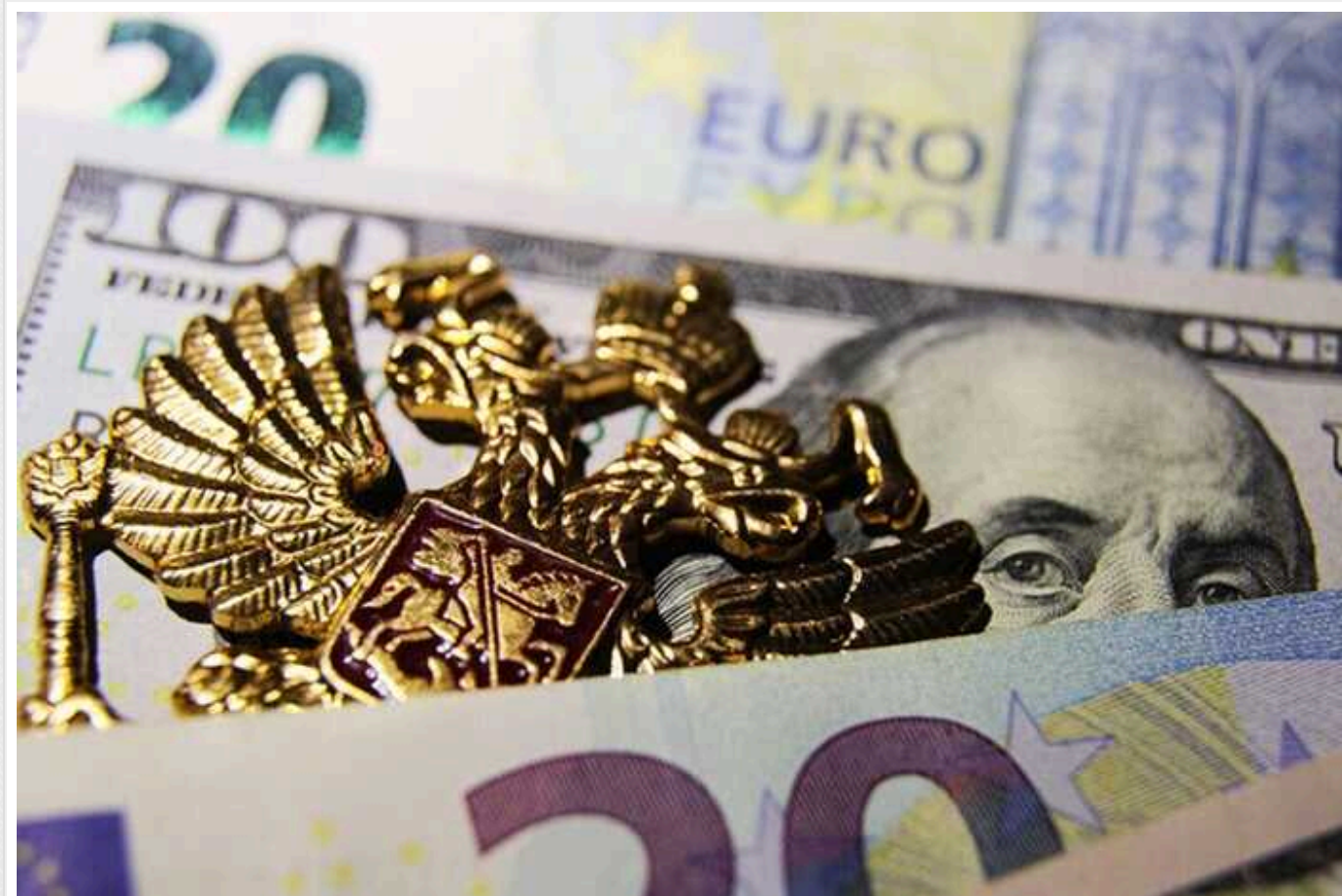
Reuters: Кремль уже "попрощався" із замороженими активами на 300 мільярдів доларів

Російська влада схиляється до думки, що заморожені після вторгнення в Україну резерви на 300 млрд доларів майже втрачені, але готові подати судовий позов і вжити рішучих заходів у відповідь.