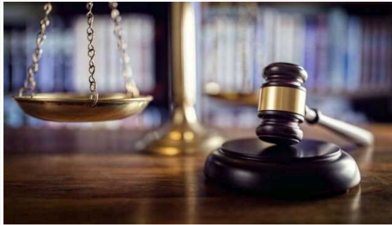
Депутата Волинської облради судитимуть за хабар у 35 тисяч доларів

НАБУ і САП скерували до суду справу депутата Волинської обласної ради, викритого на одержанні неправомірної вигоди у розмірі 35 тисяч доларів.