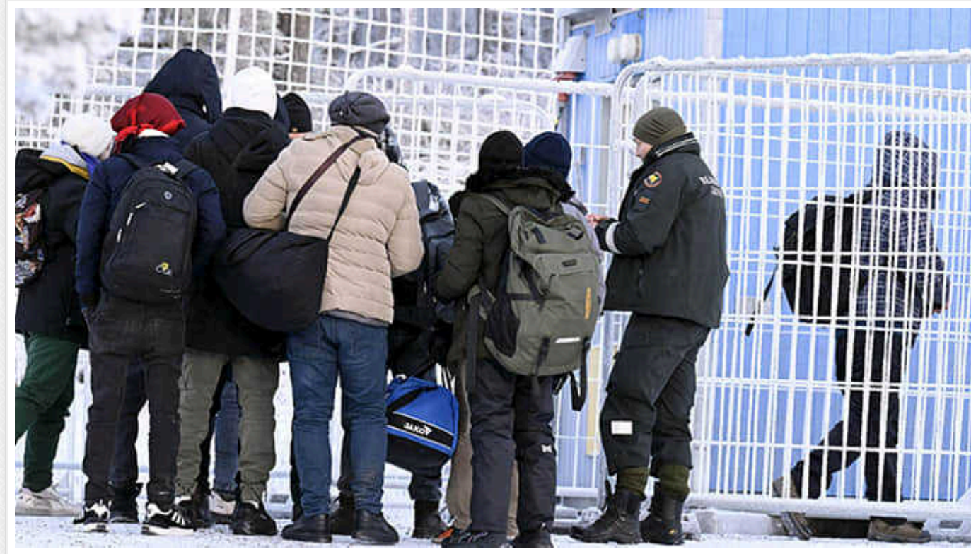
Фінляндія збудує більше укріплень від нелегалів на кордоні з РФ

Прикордонна служба Фінляндії вирішила збудувати більшу кількість тимчасових загороджень для запобігання нелегальному перетину кордону.