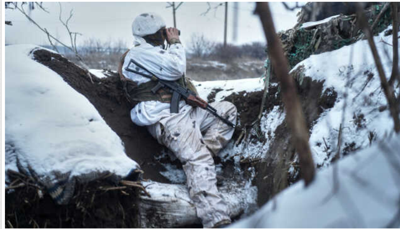
Ситуація на фронті: ворог завдав 9 ракетних та 128 авіаційних ударів, здійснив 77 обстрілів з реактивних систем

Українські війська продовжують заходи із розширення плацдарму на Херсонському напрямку та стримують ворога в Донецькій області. Протягом минулої доби відбулося 78 бойових зіткнень.