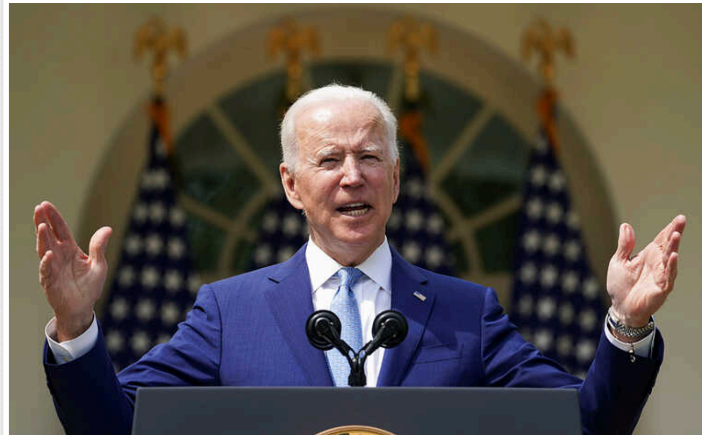
Президент США зустрівся з лідерами Конгресу і закликав ухвалити допомогу для України

Президент Сполучених Штатів Джо Байден у середу, 17 січня, обговорив із представниками Конгресу надання фінансової та військової підтримки Україні. Очільник Білого дому закликав конгресменів оперативного схвалити допомогу Україні та наголосив на важливості посилення захисту кордону від нелегальних мігрантів з Мексики.