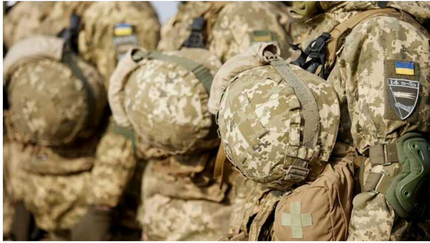
У комітеті оборони висловилися про затримання на вулицях: люди втратять довіру до ТЦК

За словами секретаря парламентського комітету з безпеки Романа Костенка, новий законопроект має бути спрямований на мотивацію громадян і на те, щоб уникнути абсурдних випадків порушення прав українців мобілізаційного віку.