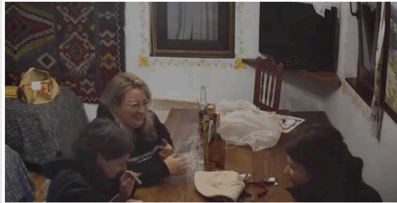
У Bihus.Info почали власні пошуки замовників стеження: "Маємо зачіпки"