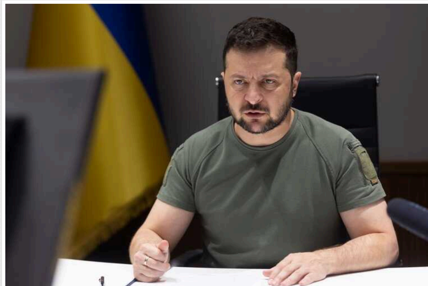
Зеленський після Давосу провів Ставку: ініціатива має бути в Україні, а не у ворога

На сьогоднішній Ставці верховного головнокомандувача після проведення у швейцарському Давосі міжнародного економічного форуму обговорили дії на стратегічному рівні. Зокрема перспективи для збереження ініціативи в Україні.