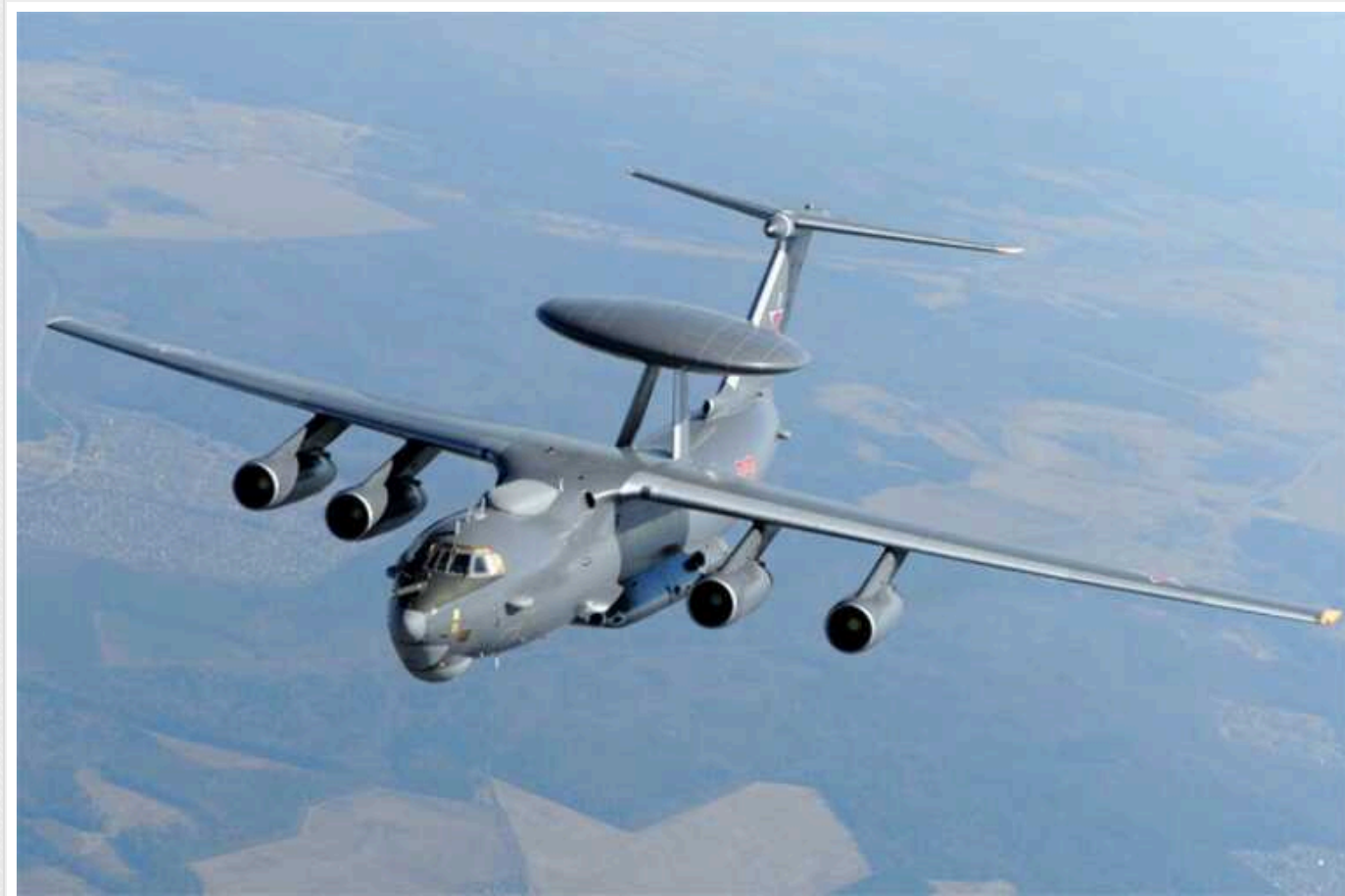
ЗСУ оприлюднили список загиблих військових РФ на борту ДРЛО А-50: "Чекаємо на парадні фото"

Серед "зниклих безвісти" росіян значаться командир борту, штурман, два капітани та інші офіцерський склад.