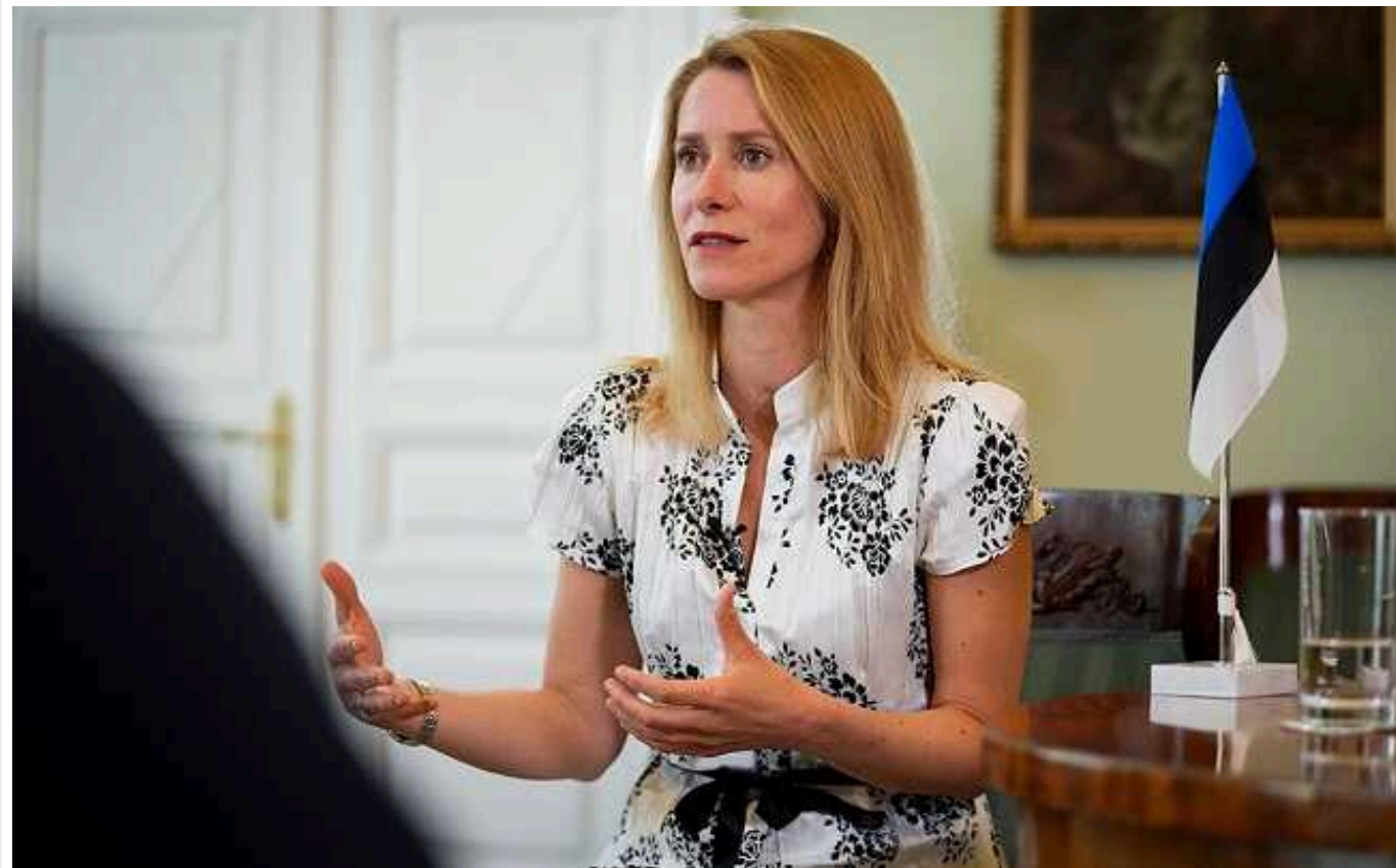
Прем'єрка Естонії Кая Каллас закликала "Рамштайн" спрямовувати Україні по 0,25% ВВП

Щонайменше 120 мільярдів євро (131 мільярд доларів), як вважає голова естонського уряду Кая Каллас, можливо залучити для України.