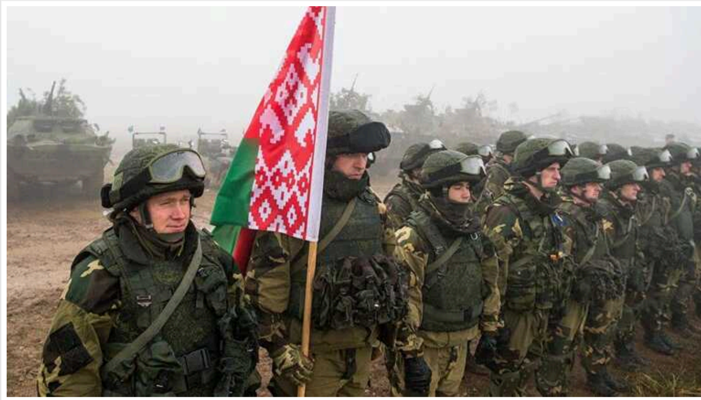
У ГУР МО оцінили можливість "нападу" Білорусі: "Блакитна мрія Путіна"

Залучення білоруських сухопутних військ до війни проти України залишається блакитною мрією російського диктатора Володимира Путіна.