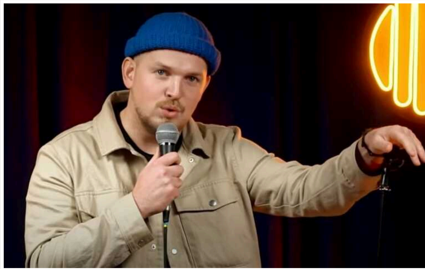
Українського стендап-коміка побили під час концерту в Дніпрі