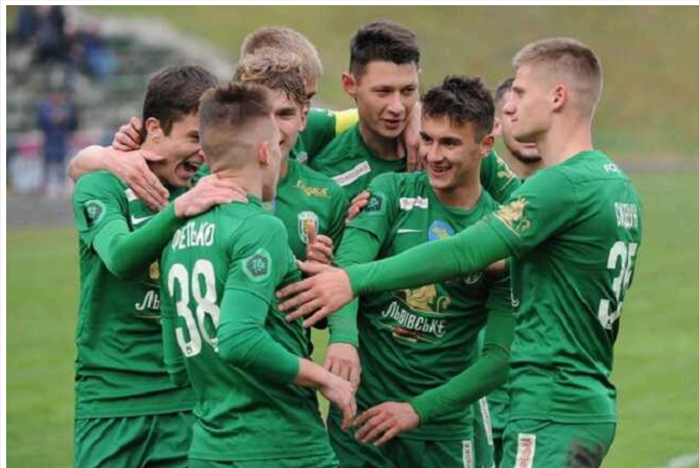
Усіх футболістів ФК Карпати не випустили з України

Міністерство молоді та спорту відмовило львівському футбольному клубу "Карпати" у виїзді з України, повідомляє Tribuna.com. За інформацією ЗМІ, команду не пустили на тренувальний збір до Іспанії.