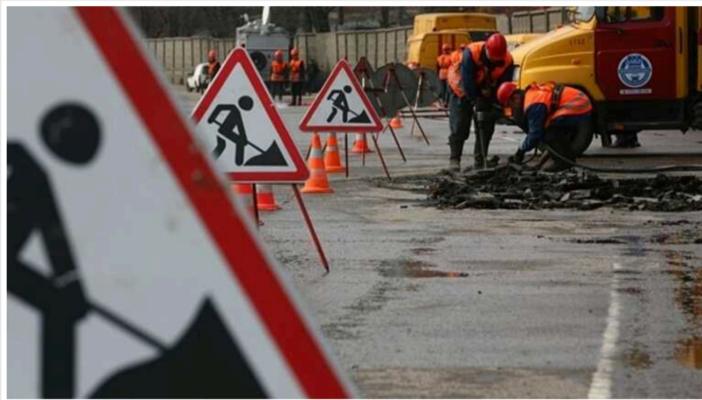
На Одещині підрядниця зменшила кількість дорожнього покриття під час ремонту; завищила вартість виконаних робіт на майже 246 тисяч гривень

На Одещині правоохоронці підозрюють місцеву підприємцю в розкраданні бюджетних коштів під час ремонту доріг у Білгород-Дністровському. Вона могла підробити документи та завищити вартість виконаних робіт на майже 246 тис. грн. Її обрали запобіжний захід у вигляді 90 тис. грн застави.