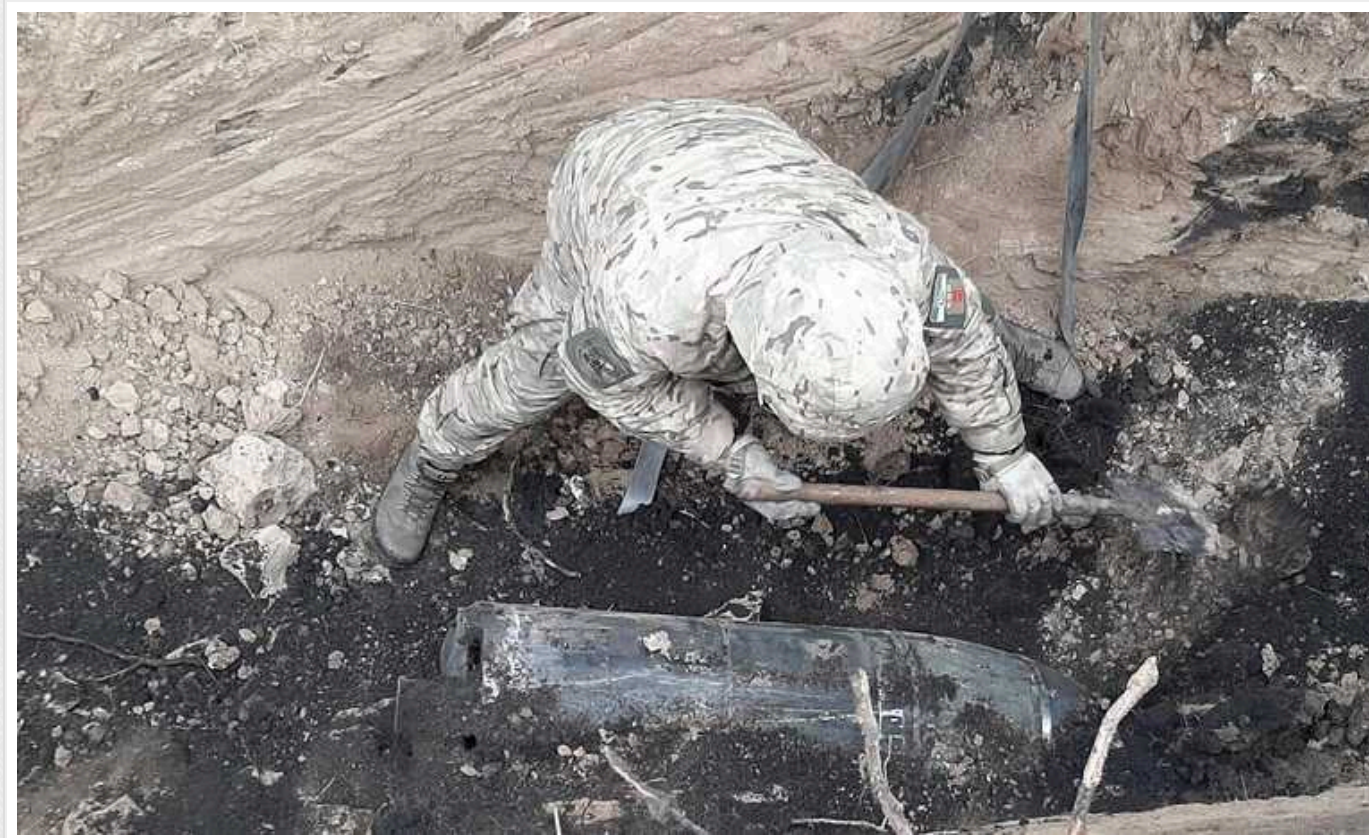
На Кіровоградщині вибухотехніки знешкодили бойові частини ракет "Кинджал", які не розірвалися під час обстрілу

У Кіровоградській області вибухотехніки знешкодили дві боеголовки російських аеробалістичних ракет "Кинджал". Їх збили українські сили протиповітряної оборони, снаряди не розірвалися, їхні залишки виявили в полі.