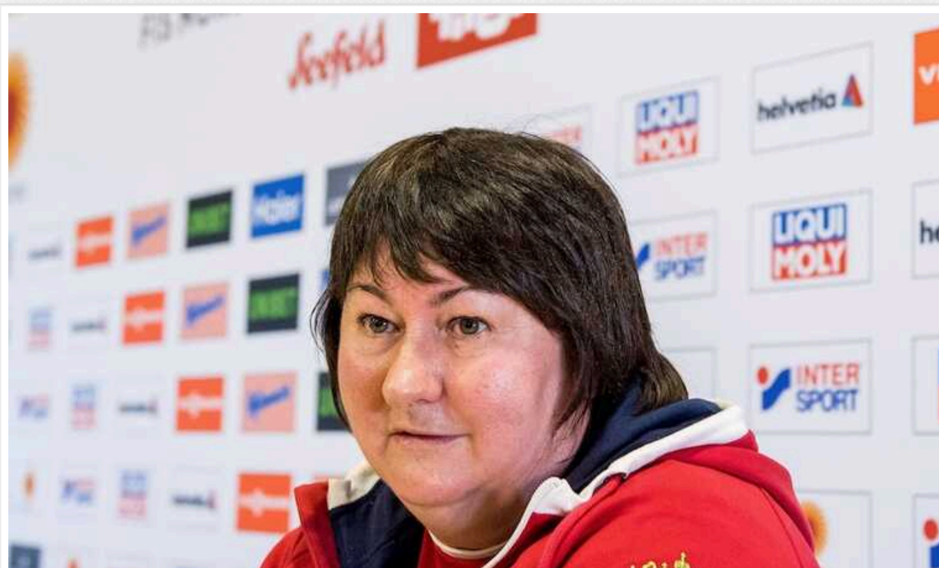
Російська олімпійська чемпіонка Вьяльбе вкотре принизилася перед Путіним

Президентка Федерації лижних гонок Росії (ФЛГР) Олена Вьяльбе назвала зрадою країни поїздку на Олімпіаду у нейтральному статусі. Триваюча олімпійська чемпіонка підтримала рішення ватажка Кремля Володимира Путіна, принизивши погодившись із усім, про що він сказав.