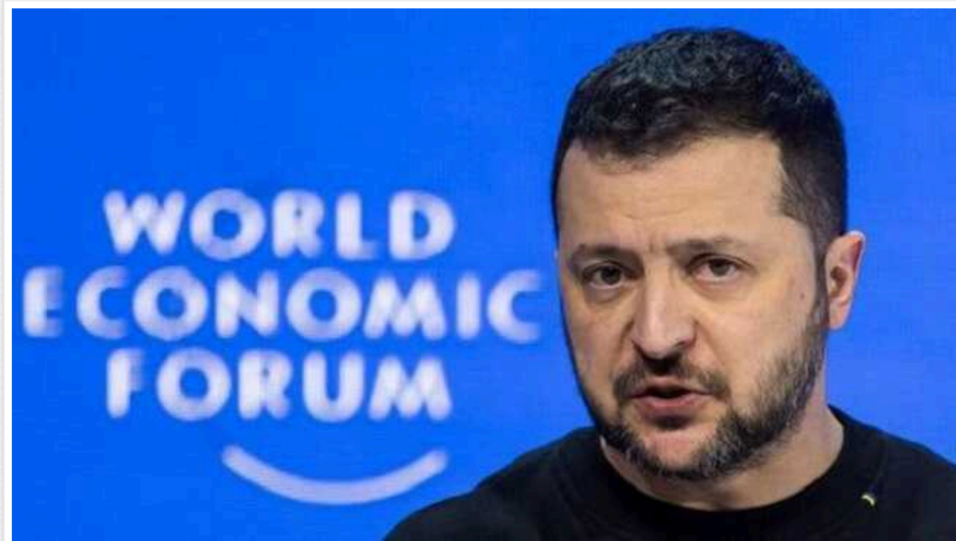
Зеленський у Давосі прокоментував слова Трампа про швидке закінчення війни: "Спочатку подумай – потім скажи"

Дональд Трамп не зможе зупинити РФ, якщо Путін захопить Україну. Американець каже, що знає шлях до миру, проте президент України Володимир Зеленський радить йому спочатку думати, а вже потім казати.