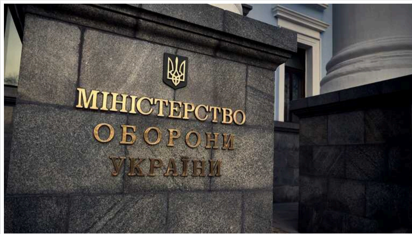
Справа Гринкевича: Міноборони подало заяву до ДБР про визнання потерпілою стороною та розірвало контракт із компанією

У міністерстві розповіли подробиці щодо завданої шкоди.