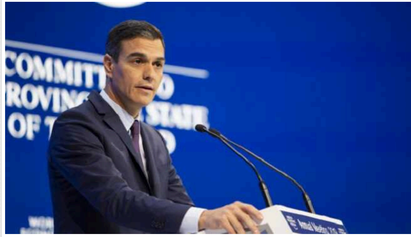
Прем'єр-міністр Іспанії Санчес: Чи буде світ стабільним у майбутньому, вирішується зараз в Україні та Газі

Політик закликає світ серйозніше ставитися до цих конфліктів, щоб вони завершилися якнайшвидше.