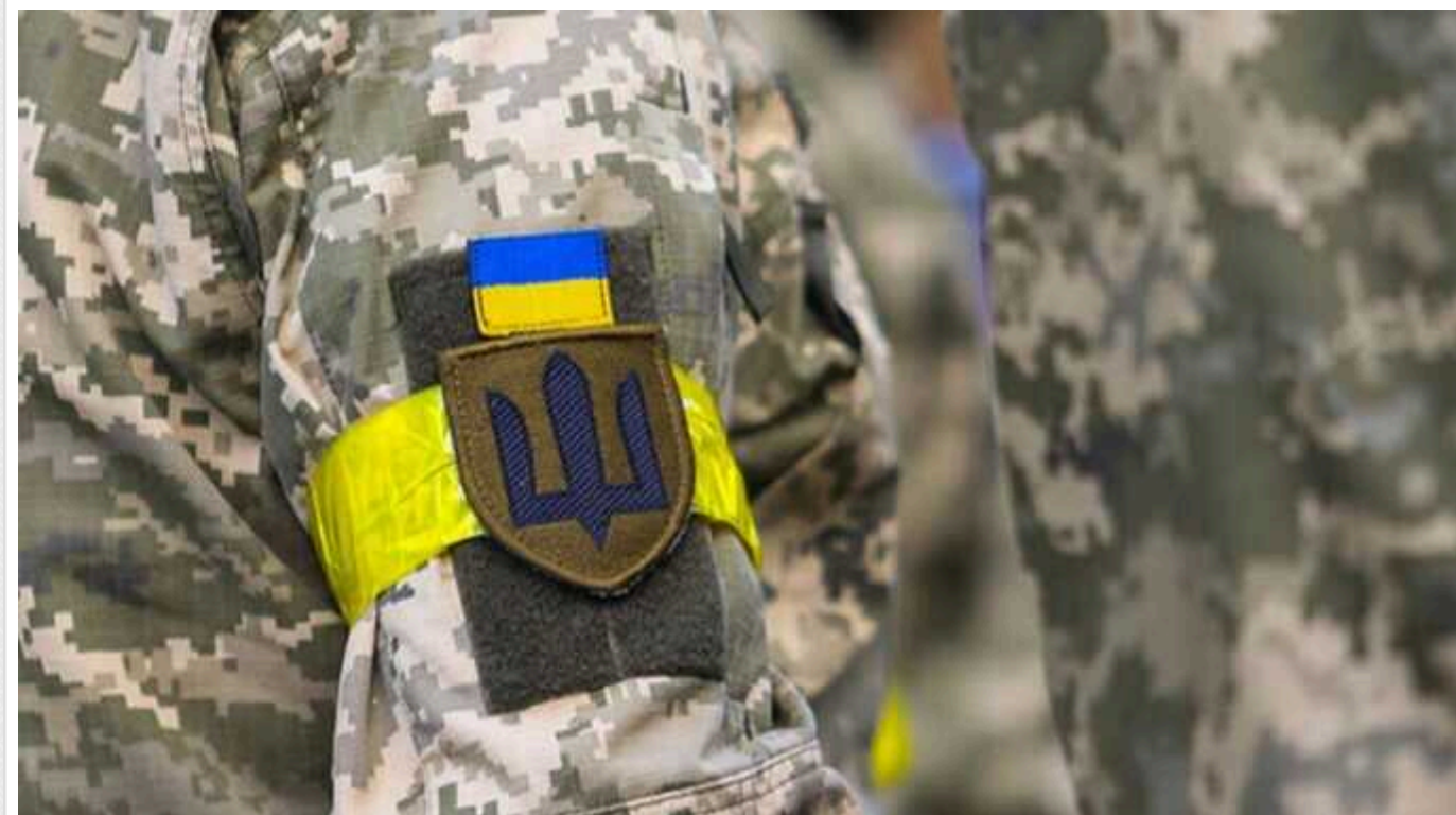
Мобілізація в Україні: адвокат назвав, за яких умов ТЦК вважають громадянина ухилинтом

ТЦК та СП можна не відвідувати після отримання повістки, але з поважних причин, які підтверджуються документально.