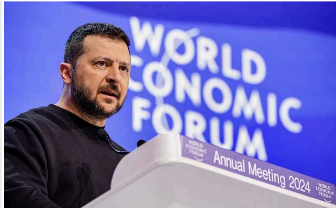
Зеленський: Росія продовжить мобілізувати трупи, Україні завжди не вистачатиме мобілізованих

РФ, яка не рахує людей, мобілізує трупи. У свою чергу Україні завжди не вистачатиме мобілізованих.