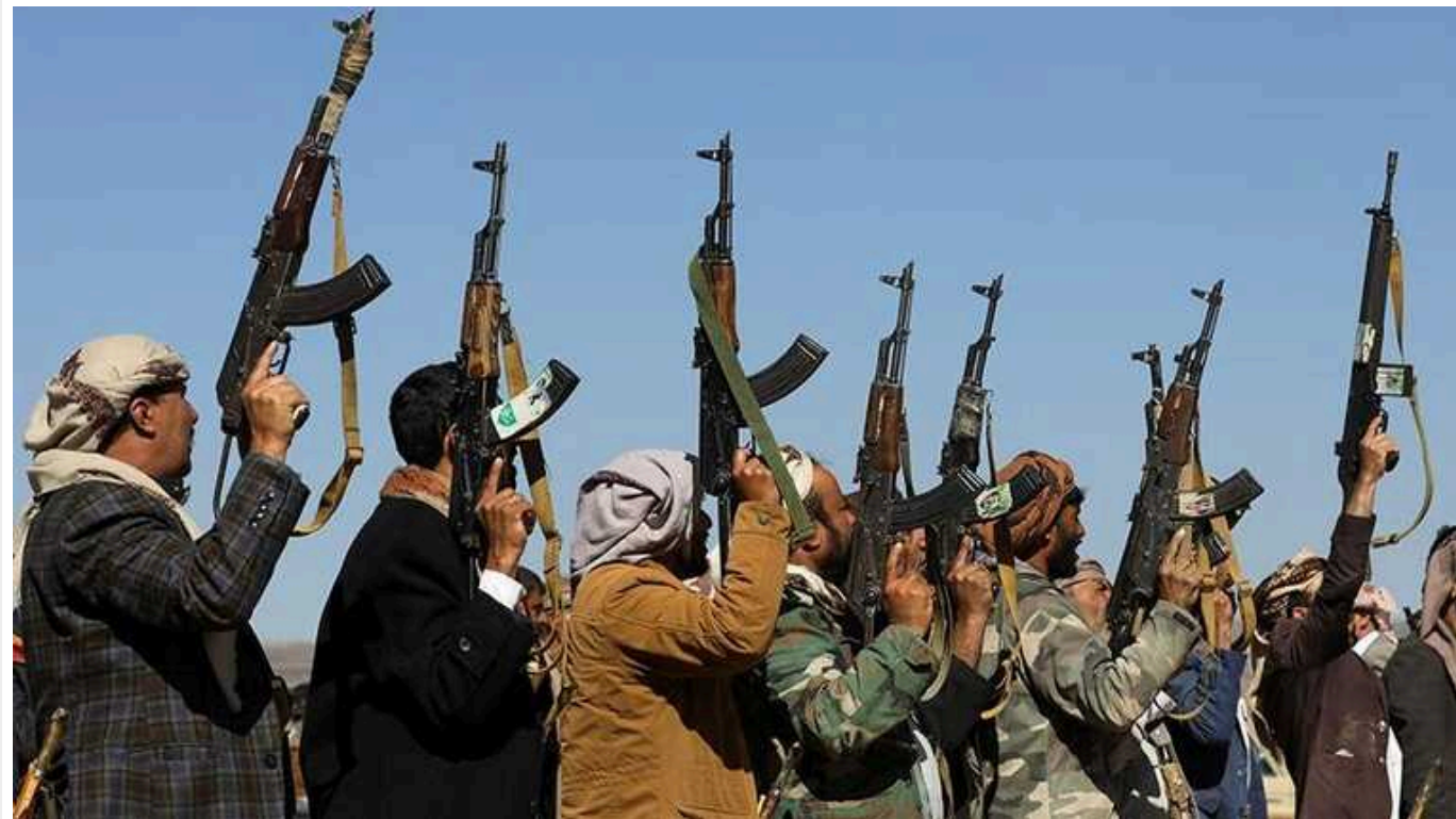
США повернули хуситам статус міжнародної терористичної організації

Сполучені Штати Америки знову внесли хуситів до списку світових терористичних організацій. Причиною став їхній напад на торгові судна у Червоному морі.