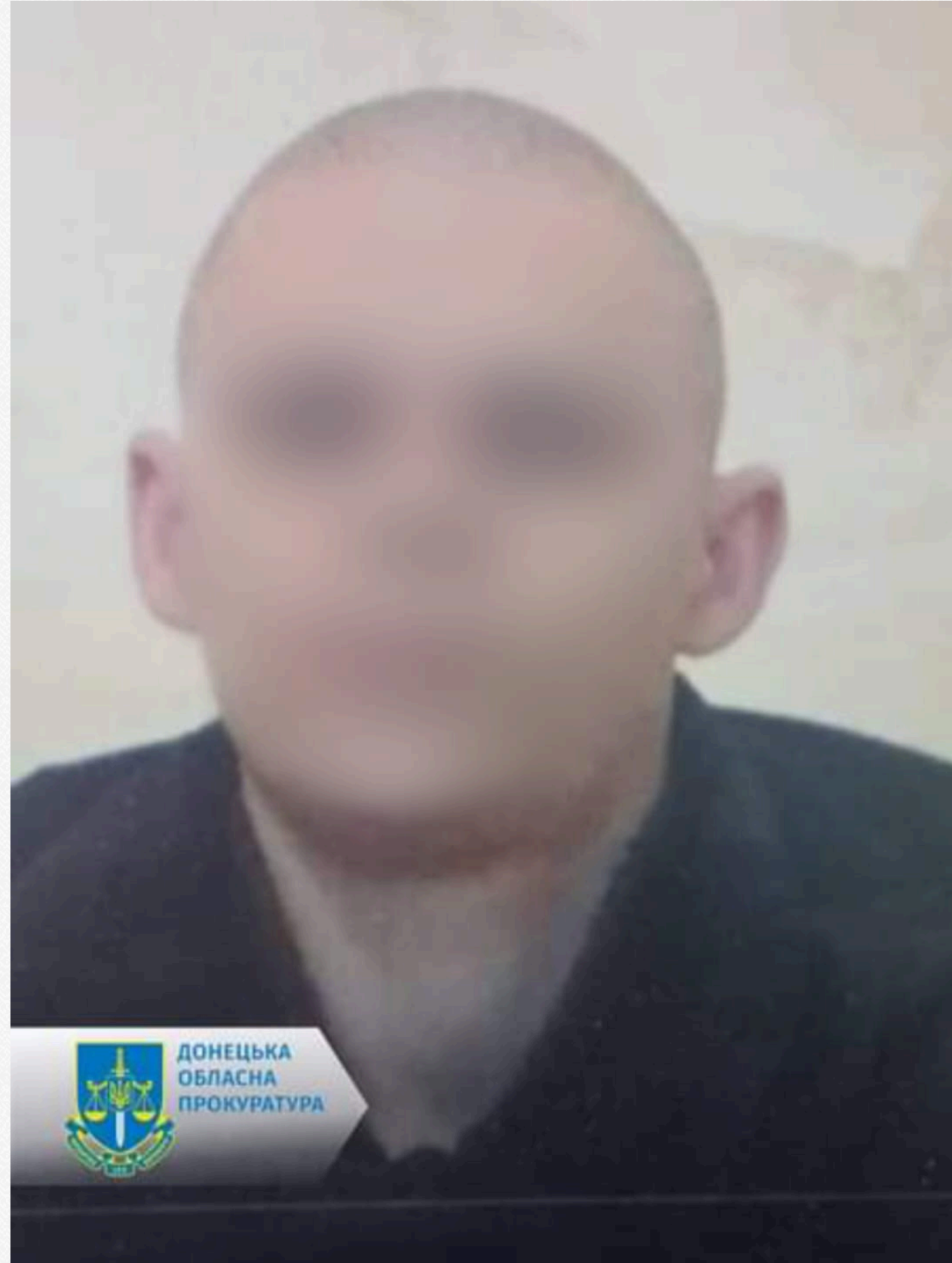
Фото: Колаборант ( facebook.com/don.gr.gov.ua )"

Деталі справи. У червні 2022 року проросійськи налаштований чоловік через мобільний додаток "Telegram" надсилав одному зі своїх співрозмовників текстові повідомлення про військовослужбовців ЗСУ, які дислокувалися у місті. Незадоволений перебуванням українських захисників на території та околицях населеного пункту, він ділився результатами власних спостережень техніки та озброєння.