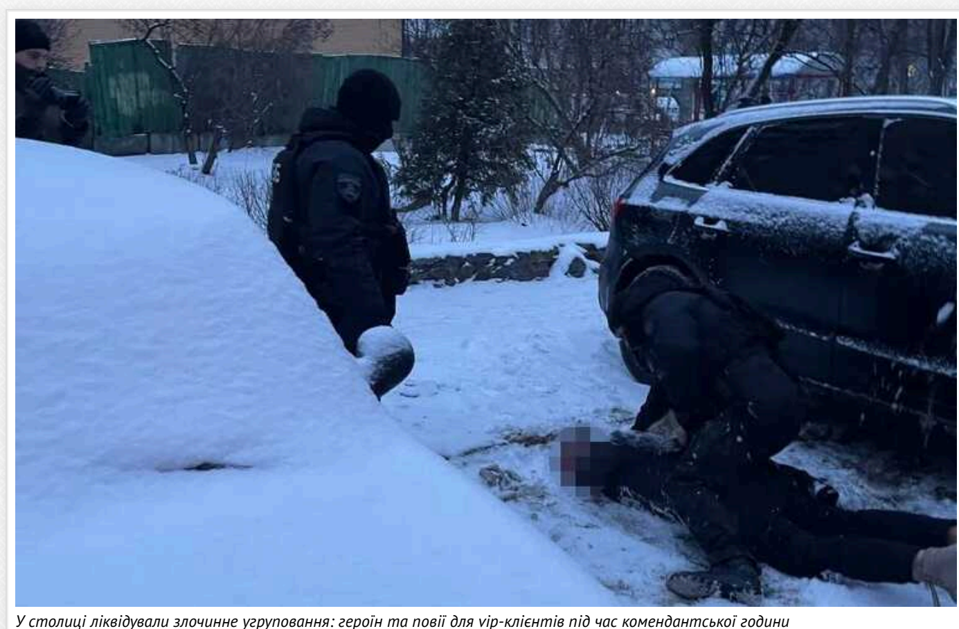
У столиці ліквідували злочинне угруповання: героїн та повії для вір-клієнтів під час комендантської години

У Києві правоохоронці ліквідували угруповання, яке постачало під час комендантської години для вір-клієнтів наркотики та повії. Зокрема, ціна за грам кокаїну складала 250 доларів, а для постійних покупців робили знижки.