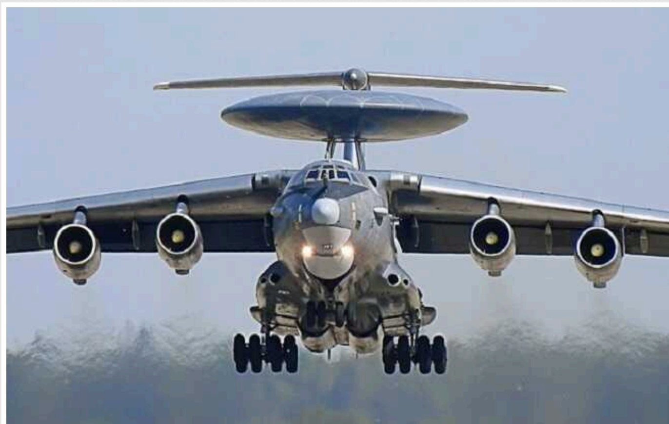
У Forbes розповіли, як ЗСУ збили А-50 та Іл-22: "Влаштували складну ракетну пастку"

За словами аналітиків, використовувалися ракети ЗРК Patriot PAC-2 дальністю 145 км. З меншою ймовірністю можна говорити про Patriot PAC-3 або С-300.